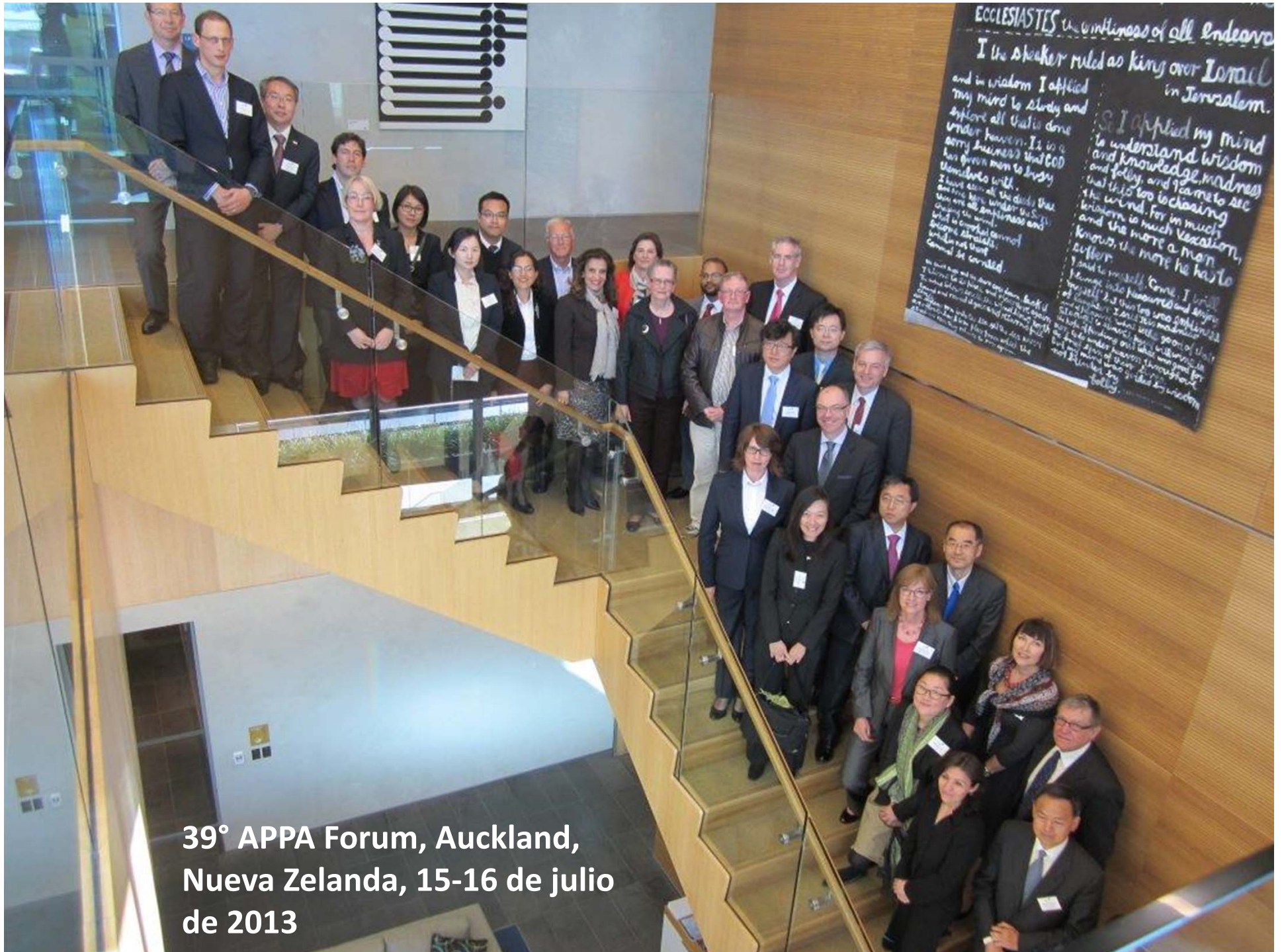
39° APPA Forum, Auckland, Nueva Zelanda, 15-16 de julio de 2013